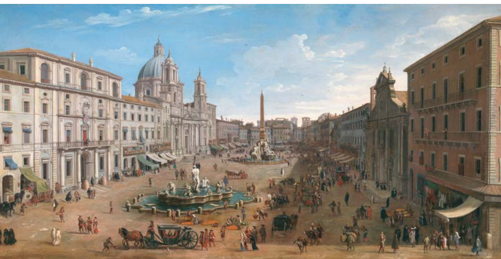
Gaspar van Wittel (Gaspere Vanvitelli, o Gaspere degli Occhiali) (Amersfoort, 1652 - Roma, 1736) Veduta di Roma con piazza Navona , 1688-1721 olio su tela, 62,5 x 125,5 cm Collezione Intesa Sanpaolo Gallerie d'Italia - Palazzo Zevallos Stigliano, Napoli

La Veduta di Roma con piazza Navona è opera di Gaspar van Wittel. Pittore olandese trasferitosi in Italia, è considerato il precursore del vedutismo moderno basato sulla precisione quasi topografica della scena.