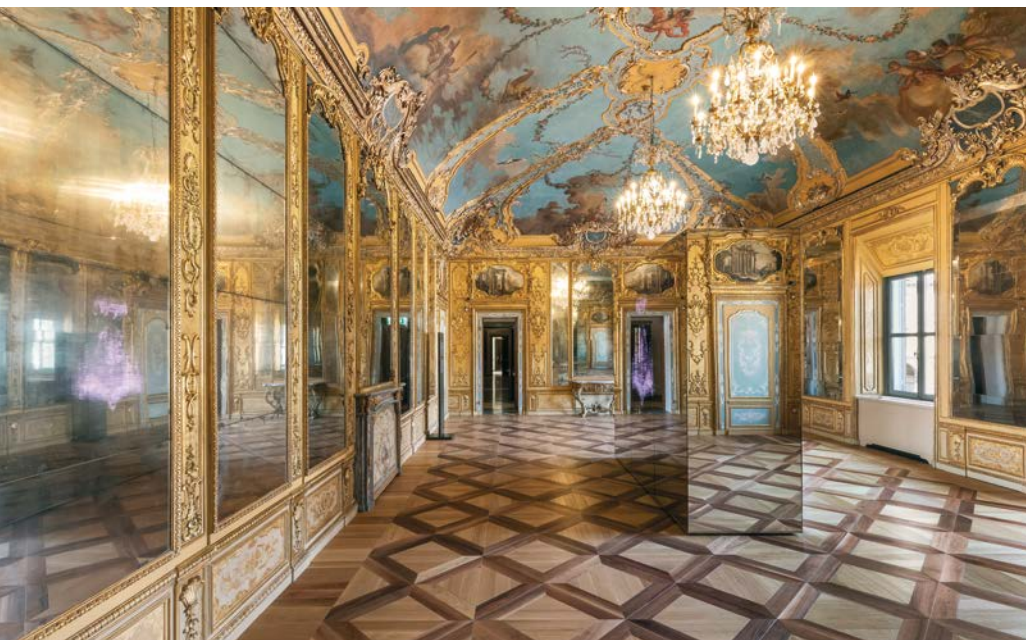
Gallerie d'Italia - Torino Sala Turinetti Piazza San Carlo 156, Torino Interno della nuova sede museale Progetto AMDL CIRCLE e Michele De Lucchi